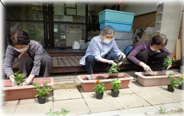
色の配置を考えて花植えをしました。