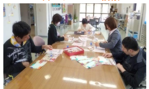
誕生日カード作り