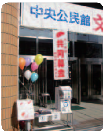
中央公民館文化祭