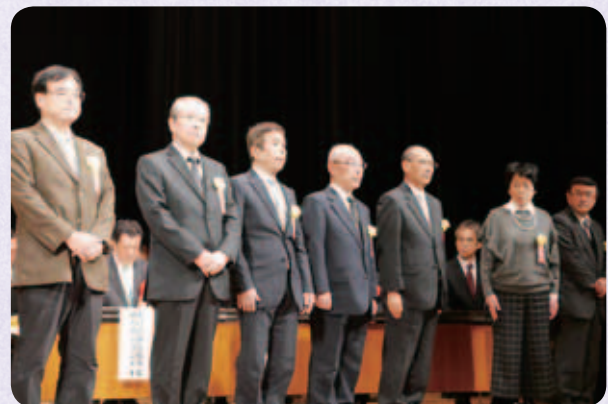
社協会長表彰の皆さん