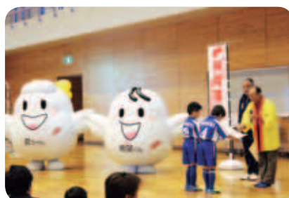
赤い羽根チャリティーカップ