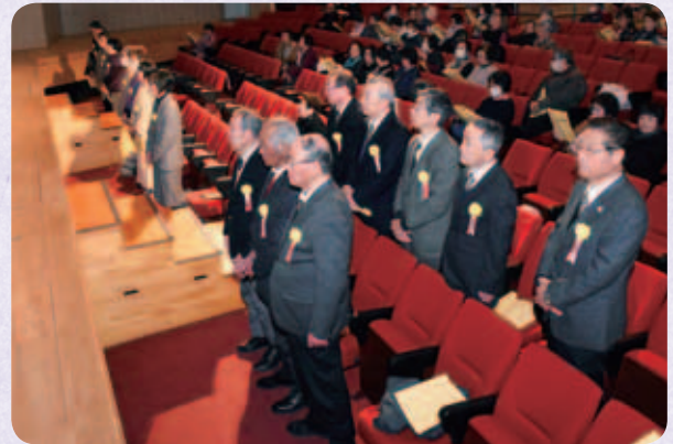
社協会長表彰の皆さん