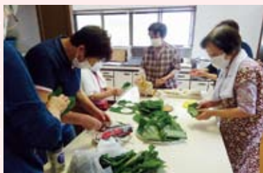
日吉町 中楼会 毎月1回様々な体験