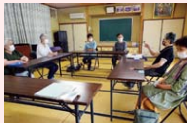
土岐町 遊友サロン 毎月1回おしゃべり

今月号の「社協だより」の表紙は、新型コロナウイルス感染防止のため集まり自体は中止としつつも、人と人との大事なつながりが切れないように、今できることを考えて行われたサロンの写真です。