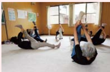
釜戸町 公文垣外サロン 毎週火曜日に体操

「社協だより」7月号より、地域の皆さんが気軽に集まるサロンを紹介しています。人とのつながりで笑顔になれる機会を増やし、心も体も元気になる場所を、あなたの地域にも作りませんか。