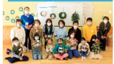
木の実や枝葉を利用したリース作り