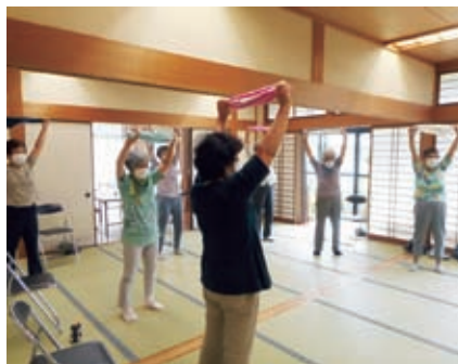
桜寿荘 元気サークル (いきいき健康体操)