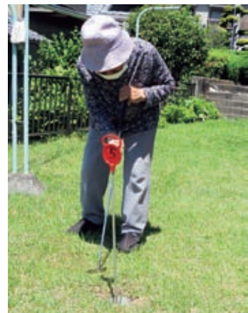
福寿荘 (パターゴルフ) ※10月からできるようになりました