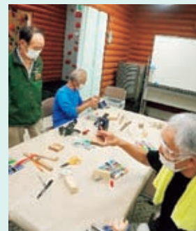
コマと竹とんぼ作り