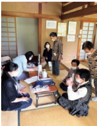
寿楽荘 お達者くらぶ (健康講話)