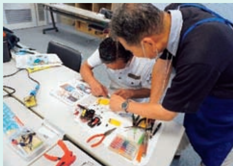
おもちゃドクターになろう