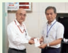
名古屋ヤクルト販売㈱