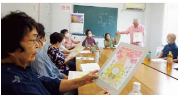
8月3日（午前）明世日吉地区（午後）稲津地区