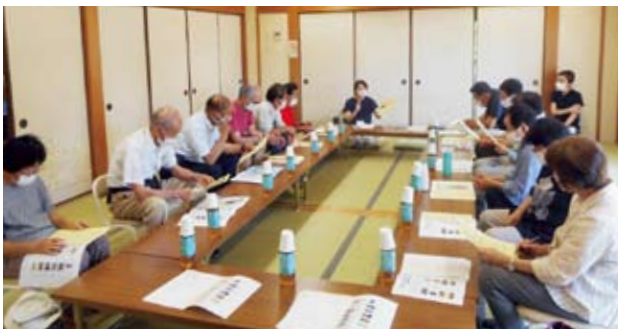
7月25日 土岐・釜戸・大湫地区