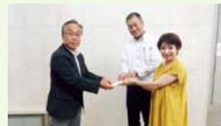
瑞浪市サッカー協会