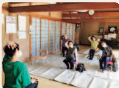
寿楽荘（しなやかヨガ）