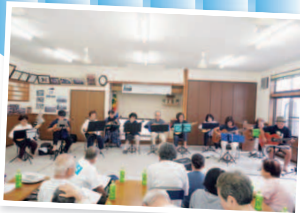
ご長寿祝賀会で演奏♪ (中原西公民館にて)