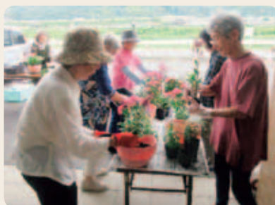
桜寿荘（楽しみ園芸教室）