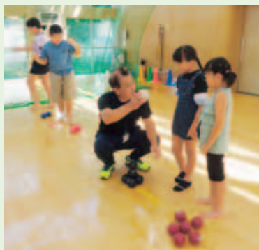
樽上児童センターの子ども達とレクリエーションを楽しみました！