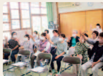
福寿荘（ヤクルト健康講座）