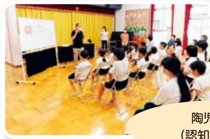
陶児童館 (認知症講座)