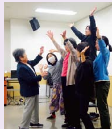
りんこの木に登る子どもを全身で表現！