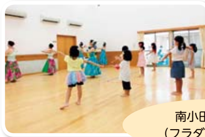
南小田児童館 (フラダンス体験)