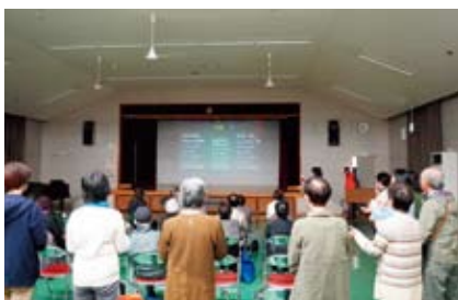
コーラスグループさんと合唱