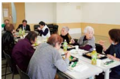
お食事をしながら歓談