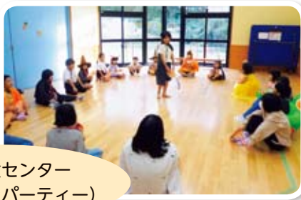
土岐児童センター (ハロウィンパーティー)