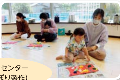
樽上児童センター (こいのぼり製作)