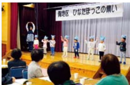
園児のお遊戯とうた