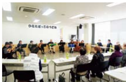
マンドリン演奏♪いい音色