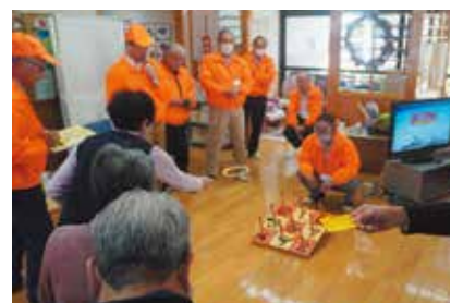
12/6 土岐支部 毎年恒例の輪投げ大会

市内在住の70歳以上のひとり暮らしの方で、「ひなたぼっこのつどいに誘われたことがない」という方は、社会福祉協議会またはお住いの地区の福祉委員にお伝えください。社会福祉協議会に登録いただくと、このような行事に参加していただけます（登録には一定の基準があります）。また、月1回お住いの地区の福祉委員による声かけ訪問等をさせていただきます。