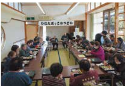
11/16 日吉支部 みなさんでお食事