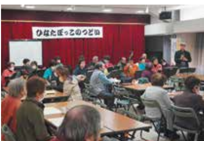
11/23 釜戸大湫支部 マンドリン演奏