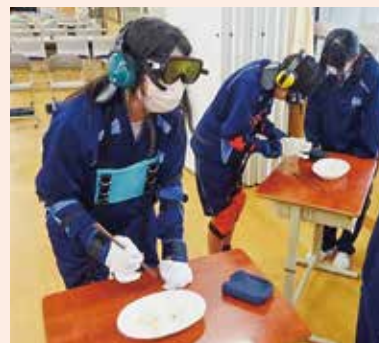
写真は11月10日(月)に瑞浪南中学校にて行われた出前講座の様子です

体験を通して、相手の気持ちに寄り添って行動することやあたたかい福祉の心を学んでいただきました。学校だけでなく、一般企業やサロンなどへも出かけていきますので「福祉について学んでみよう」と思われたときには、社会福祉協議会へご相談ください。