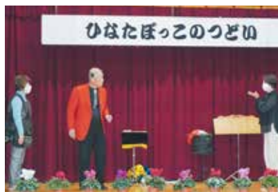
11/20 稲津支部 写真左：マジックショーに参加 写真右：マジックにくぎ付けな様子