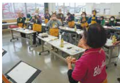
11/25 明世支部 衣装を着て、大正琴の音楽に合わせて踊ります