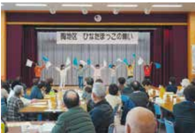
11/13 陶支部 陶こども園児の踊り

ゆっくりおしゃべりをしながら交流を深めていただくことを大切にし、楽器演奏やゲームなど、みなさんに楽しんでいただけるような内容でした。